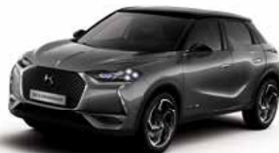
Gris Platinum dakkleur Noir