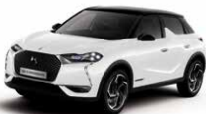
Blanc Banquise dakkleur Noir