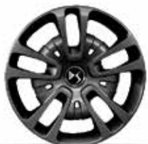
16" Stalen wielen