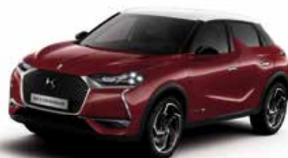
Rouge Rubi dakkleur Blanc