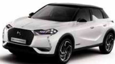
Blanc Perle dakkleur Noir