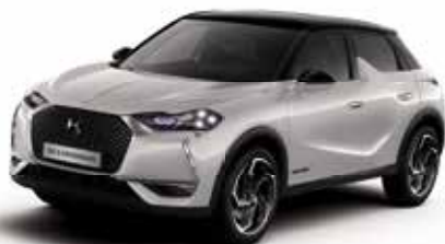
Crystal Pearl dakkleur Noir