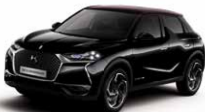
Noir Perla Nera dakkleur Diamond Red