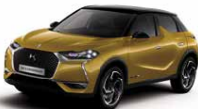
Imperial Gold dakkleur Noir