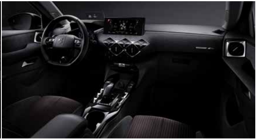
DS-INSPIRATION 'PERFORMANCE LINE'