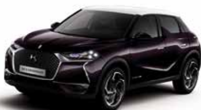
Whisper dakkleur Blanc