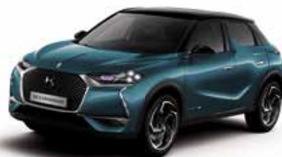
Bleu Millenium dakkleur Noir