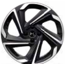
18" Sao Paulo