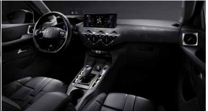
DS-INSPIRATION 'OPERA' Art Basalte