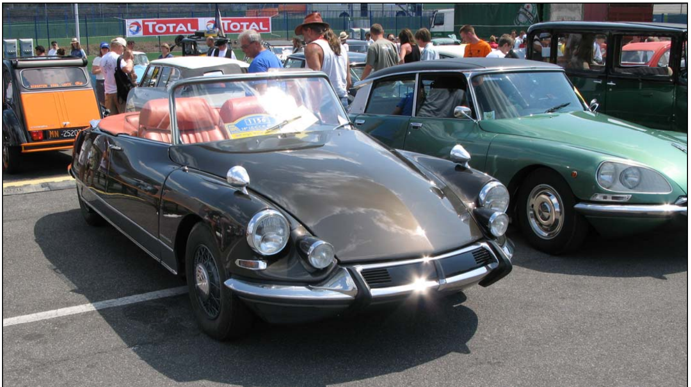
De vorige ICCCR: 2008 in Vallerlunga, Italië

De meeste zaken zijn terug te vinden op de site, maar we willen u toch ook nog even via ons papieren medium warm maken voor een bezoek aan deze wereldmeeting - de jamboree van Citroënnisten, zeg maar. Waar eigenaren/liefhebbers van alle types welkom zijn, van tot nieuw-gerestaureerde achterwielaandrijver via Traction, Snoek, CX, HY en customized 2cv tot de meest recente C- & DS3/4/5-modellen.